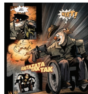
© Vesa Vitikainen, Markus Tuppurainen, Julia Riitijoki