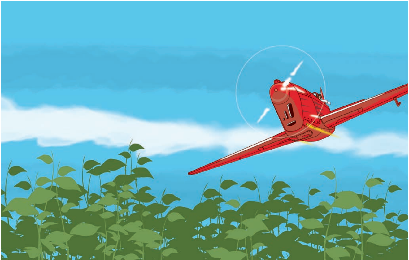
Fascinationen över att teckna flygplan sitter kvar. Ett prov ur författarens projekt under år 2018. © Ilpo Koskela

serier med Jean Girauds Blueberry samt Uderzos och Jijés Jaktfalkarna blev en ansenlig kulturchock!